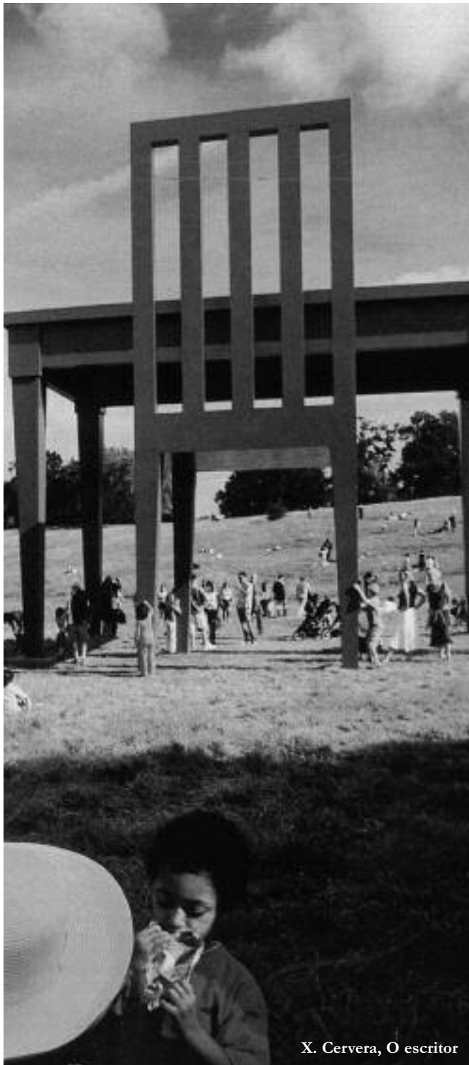
X. Cervera, O escritor

americano, ficamos empurrados a diagnosticarmos que o procedemento seguido para a obtención desta fotografía non pode ser outro que, como no caso da de Pedro Meyer, o da técnica dixital. E, non obstante —e, de novo, debo pedir que se acredite en min— a fotografía é unha auténtica xoia diso que, pretensiosamente, chamamos realismo. Trátase da fotografía (a orixinal é a cores), tirada polo fotógrafo Xavier Cervera, da obra que leva por título O escritor , instalación do ano 2005, de nove metros de altura, obra de Giancarlo Neri, situada no parque Hampstead, de