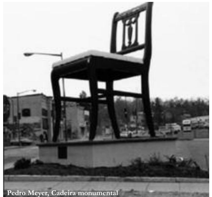
Pedro Meyer, Cadeira monumental

A seguir mostra-se unha imaxe cunha temática moi semellante: tamén unha cadeira cuxas dimensións son —contra a lóxica que dita a nosa experiencia diária— moi superiores ás das persoas que se achán en volta dela. Nada, en orixe, basilaramente distinto da fotografía anterior: nas dúas ficen presentes espazos abertos, nas dúas, a cadeira ocupa un lugar sobranceiro e configura, en ambos os dous casos, polo seu tamaño, unha situación que se podería cualificar de excéntrica, de irreal. Acostumados hoxe ao feito dixital, á chamada manipulación, acautelados pola experiencia fornecida pola imaxe do fotógrafo