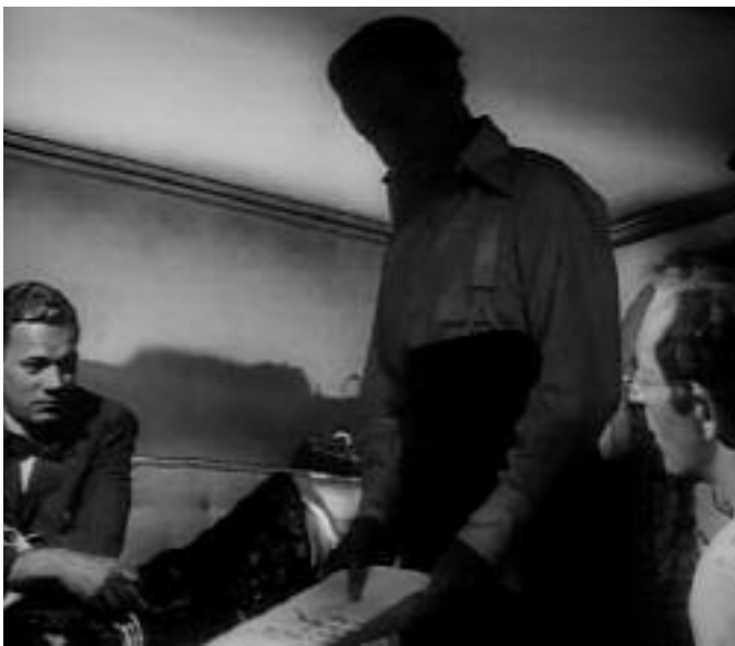
Fotograma de Citizen Kane

E, polo mesmo motivo, como dicíamos, falarmos de fotografía manipulada é equivalente a formularmos unha tautoxia. Toda fotografía é a consecuencia dunha manipulación sub-